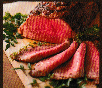
ローストビーフカービング ¥1,700